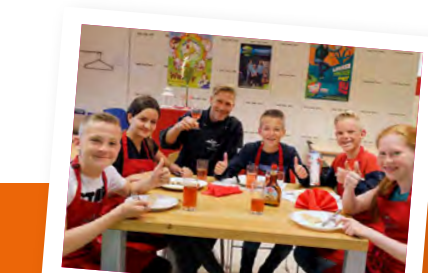
Onze Fioretti modellen, hadden jullie ze al herkend?